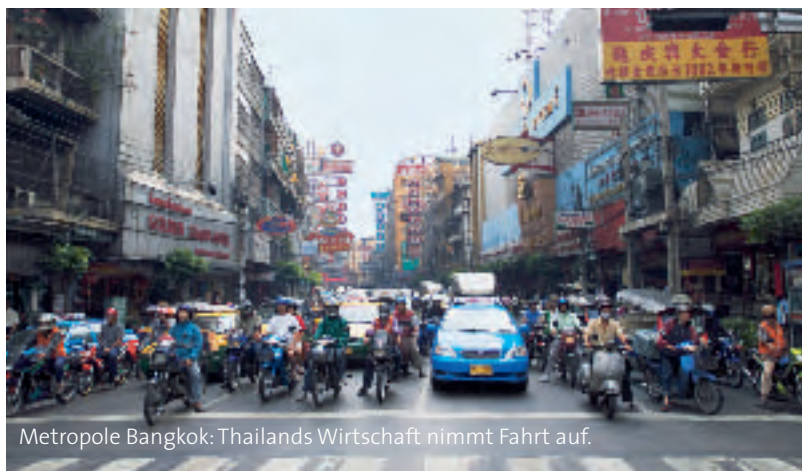
Metropole Bangkok: Thailands Wirtschaft nimmt Fahrt auf.

Dyckerhoff: Man muss sich mit den Gesetzen des Landes vertraut machen: Kann das Geld frei ins Land fließen oder gibt es Restriktionen? Vieles ist jedoch auch Vertrauenssache: Wir beispielsweise sind als reine Finanzierer tätig. Unser Geld geht auf vor Ort eingerichtete Bankkonten. Von dort übernehmen die Englischlehrer die Auszahlungen und gewährleisten, dass die Fördergelder in unserem Sinne verwendet werden. ◀